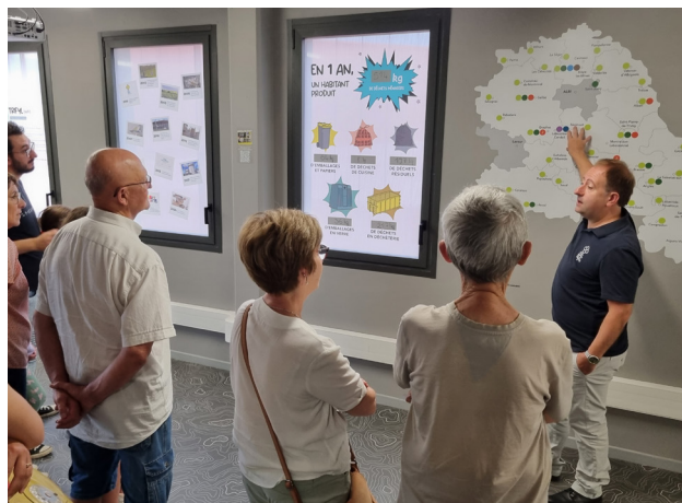
Le territoire de Trifyl est devenu une référence nationale en matière de gestion durable des déchets

UNIQUE EN FRANCE, LE NOUVEAU MODE GESTION DES DÉCHETS MÉNAGERS DE TRIFYL PERMET DE VALORISER UN MAXIMUM DE DÉCHETS MÉNAGERS