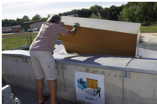
Organiser son dépôt, c'est préserver sa sécurité... et celle des autres