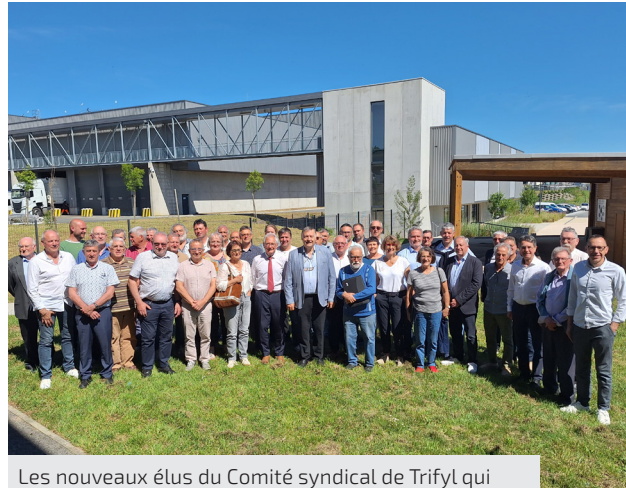
Les nouveaux élus du Comité syndical de Trifyl qui statueront pour six ans sur les grandes orientations du Syndicat mixte de valorisation des déchets.

Le Comité syndical se réunit plusieurs fois par an afin de statuer sur les grandes orientations : budget, travaux, contrats, tarifs et projets structurants. Il élit en son sein le Président et le Bureau exécutif, chargés de préparer les dossiers soumis à délibération. Pour gagner en efficacité, une partie de la gestion courante est confiée à ce Bureau composé de 19 membres permanents.