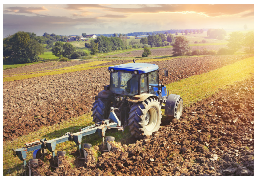
Trifyl valorise déjà nos déchets verts et nos biodéchets en amendement pour enrichir les sols agricoles.

Premier flux des déchèteries, les déchets verts peuvent contribuer à préserver les sols. Avec le projet tarnais Objectif Sol , porté par le Syndicat Mixte du Bassin Versant TarnAval, Trifyl va fournir du broyat de déchets verts aux agriculteurs pour enrichir la terre, limiter l'érosion et réduire l'usage d'engrais. Ce programme réunit 29 partenaires (collectivités, agriculteurs, chercheurs) mobilisés pour restaurer les sols et accélérer une transition écologique ancrée localement.